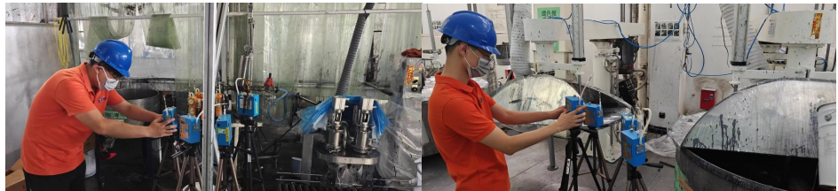
1#甲类车间珍珠银色搅拌区