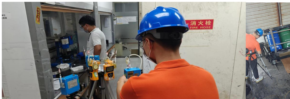
办公楼1F实验室研发搅拌台