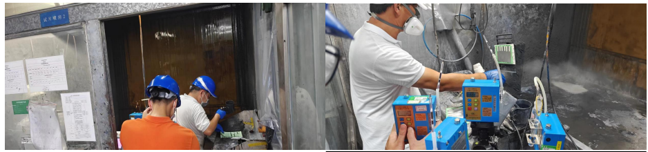
1#甲类车间品检喷房